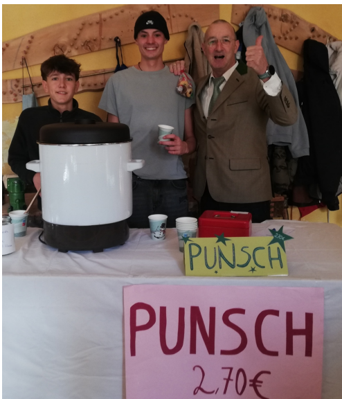
Die 10. Klasse

Heuer gab es erstmals beim Adventsbasar einen Punschstand. Die Schüler und Schülerinnen der 10. Klasse waren für die Organisation und Durchführung zuständig. Es gab einen köstlichen alkoholfreien Punsch und die Jugendlichen hatten viel Spaß beim Verkauf.