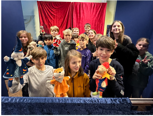
Die 6. Klasse

"Kasperl rettet Weihnachten" war das Motto der Kasperltheater-Aufführung der 6. Klasse. Gemeinschaftlich wurde das selbstgeschriebene Stück erarbeitet und voller Engagement am Adventsbasar präsentiert.