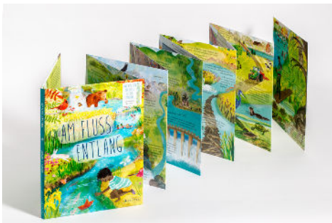
Jo Empson: Am Fluss entlang

Neuer Band der beliebten Sachbilderbuchreihe im Leporelloformat Nach "Unter meinen Füßen", "Unter mir das Meer" und "Der weite Himmel über mir" geht es nun auf 2,5 Metern den Fluss entlang, von der Quelle bis zur Mündung ins Meer. Eine spannende Entdeckungsreise ab 5